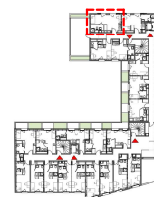
Plan de repérage / niveau 6